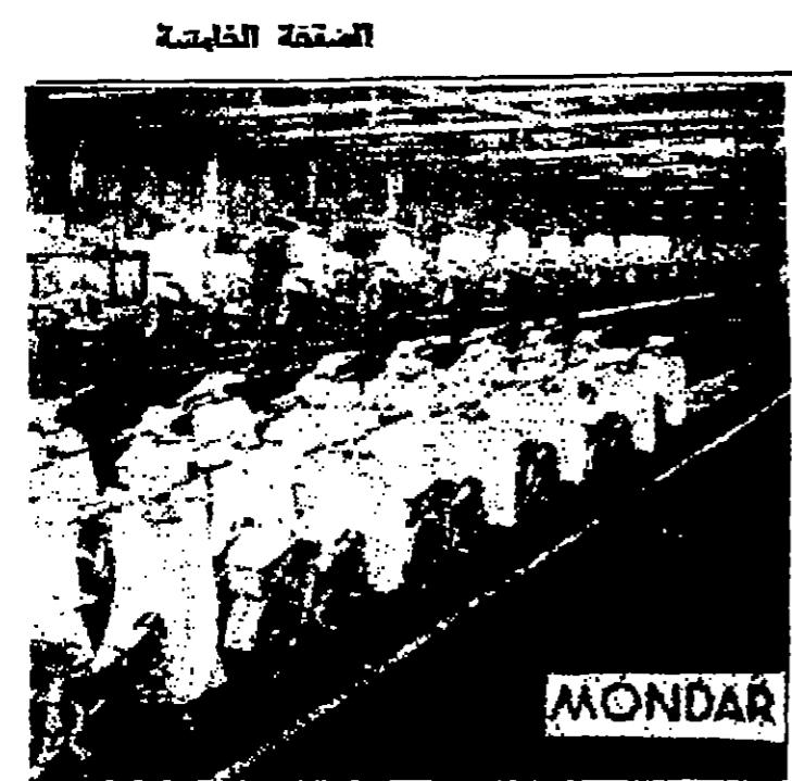
في الصورة: سبعة من التوربينات والادارات لصنع كبر لتوليد الكهرباء